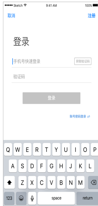
登录过程隐去多余信息